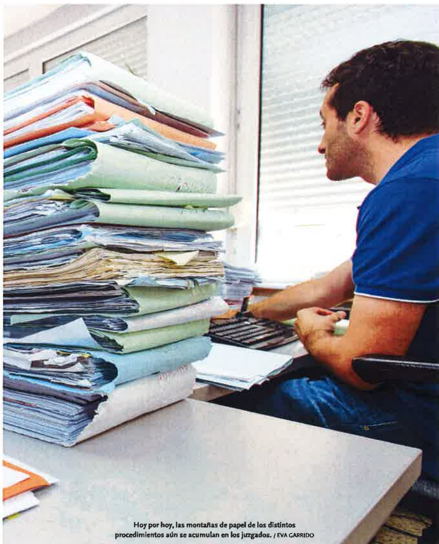
Hoy por hoy, las montañas de papel de los distintos procedimientos aún se acumulan en los juzgados.

CONTINUO BLOQUEO DEL SISTEMA. La plantilla de las sedes judiciales critica el desconcierto que sufre por las continuas caídas de 'Minerva', el sistema telemático de gestión procesal. Todos los centros de salud se han incorporado ya a la red en conexión con los distintos juzgados