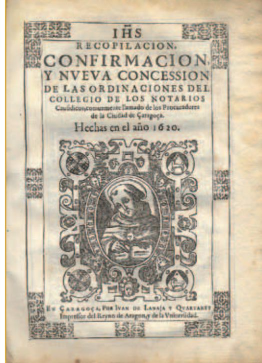
Ordenaciones de 1620.

Colegio el 18 de abril de 1640, en el cual, y alegando la defensa de los fueros y privilegios de sus miembros, exigían el derecho exclusivo a ejercer la Procura y la consiguiente inhabilitación de quienes sin ser procuradores abusasen de ello, así como el de reunirse en las casas de la Diputación del reino de Aragón.